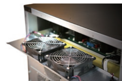
Ventilador redundante que melhora a confiabilidade do sistema