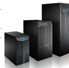
Alta performance das séries HPH UPS

Todas as especificações estão sujeitas a alterações sem aviso prévio.