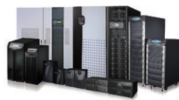
A Delta oferece uma gama completa de soluções em fornecimento de energia de 600 VA até 4000 kVA.