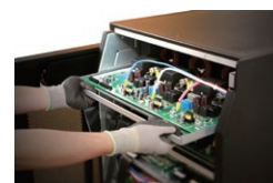
Arquitetura interior swap para rápida e fácil manutenção*