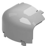
Vertical Externa 90°