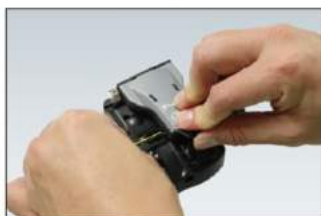
Clive a fibra