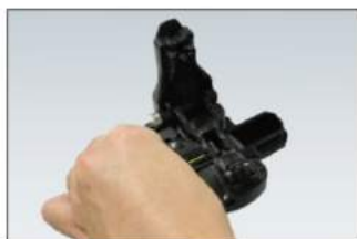
Posicione a fibra